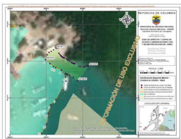
Imagen No. 2. Zona de Bañistas, Zona de Acceso a Embarcaciones con Motor y Sin Motor en la Ciénaga de Cholón, Barú - Cartagena D. T. y C.

Artículo 4.2.5.4.4.8. Zona de acceso a naves sin motor: contempla un área de trescientos cincuenta y nueve metros cuadrados (359 m 2 ), contigua hacia el Norte de la Zona de Bañistas, hasta un área de protección de cinco metros (5 m) de distancia de las raíces adventicias del manglar presente en la zona, por lo que presenta un ancho variable que va desde los diez metros (10 m) hasta los diecinueve metros (19 m). Se ubica en terrenos con características técnicas de Agua Marítima el área de playa que permite el embarque y desembarque de personas